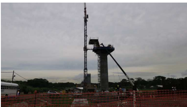
Imagen 5: Lugar del trabajo : pila 14 del tercer puente sobre el canal