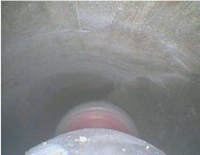
Imagen 3 : Vista desde la camera en la cabeza del robot fresador. Se ve la cabeza de diamante industrial girando y la superficie del tubo de acero en el cual se encuentra.