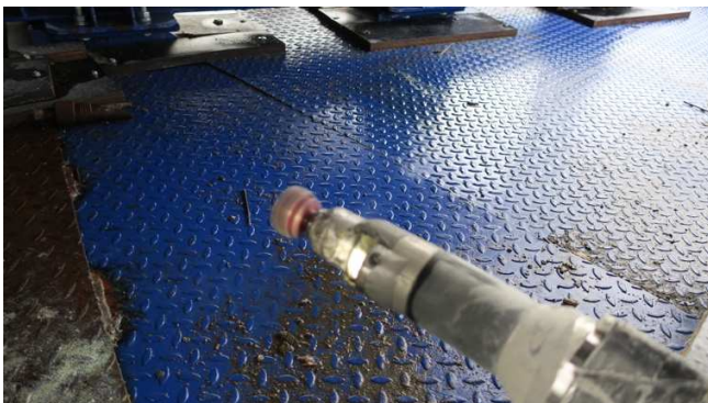
Imagen 4 : Cabeza del robot